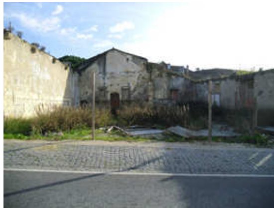
Figura 4 – Terreno expetante na Rua Victor Coutinho da Costa