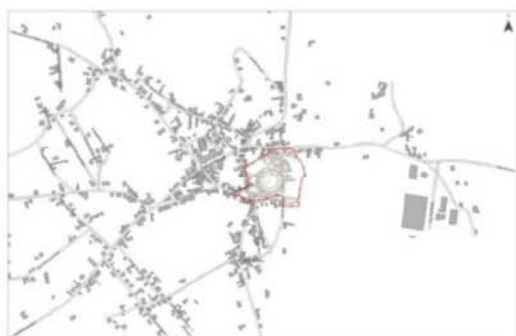
Planta 3: Área de Reabilitação Urbana 3 de Manique do Intendente

O Regime Jurídico da Reabilitação Urbana estabelece no seu artigo 15.º que a delimitação de área de reabilitação urbana caduca se, no prazo de três anos, não for aprovada a correspondente operação de reabilitação.