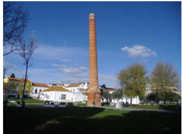
Figura 10 – Jardim Urbano de Azambuja