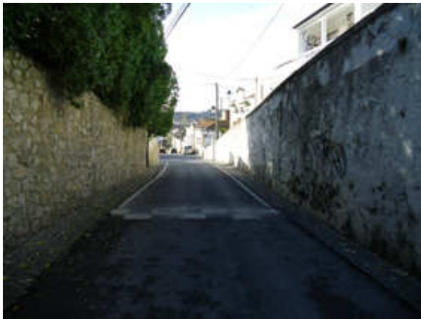
Figura 9 – Rua estreita com passeios diminutos na Victor Coutinho da Costa