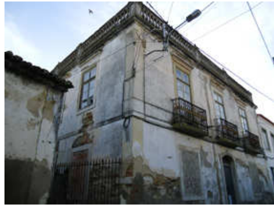
Figura 2 – Edifício devoluto na Rua de Trás da Igreja