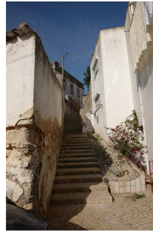
Figura 8 – Travessa do Ildefonso, rua estreita e declive acentuado de acesso pedonal