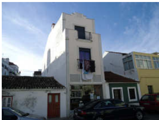
Figura 6 – Dissonâncias urbanas na Rua Doutor Jaime Abreu da Mota