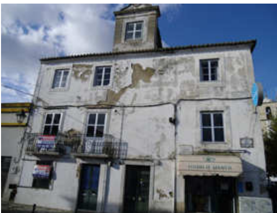
Figura 5 – Edifício em mau estado de conservação na Rua Victor Córdon