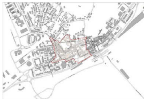
Planta 2: Área de Reabilitação Urbana 2 de Azambuja