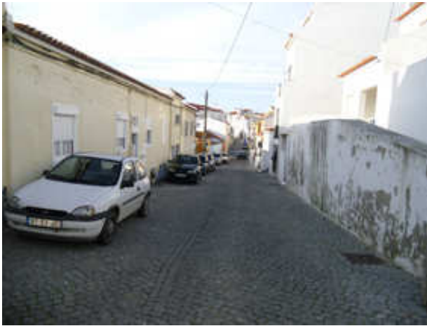
Figura 7 – Rua Frei Jerónimo da Azambuja, sem estacionamento demarcado