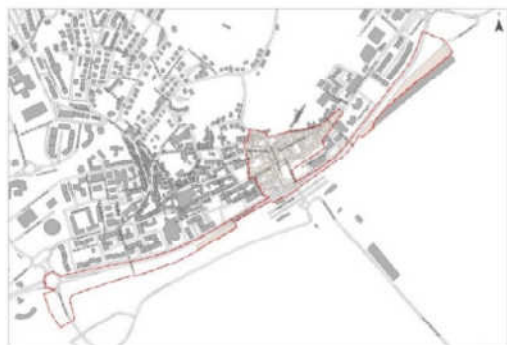
Planta 1: Área de Reabilitação Urbana 1 de Azambuja