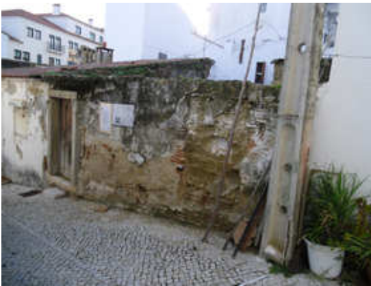
Figura 3 – Edifício em ruína na Travessa das Flores