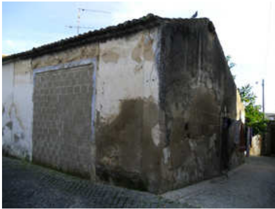
Figura 1 – Edifício devoluto na Rua de Trás da Igreja