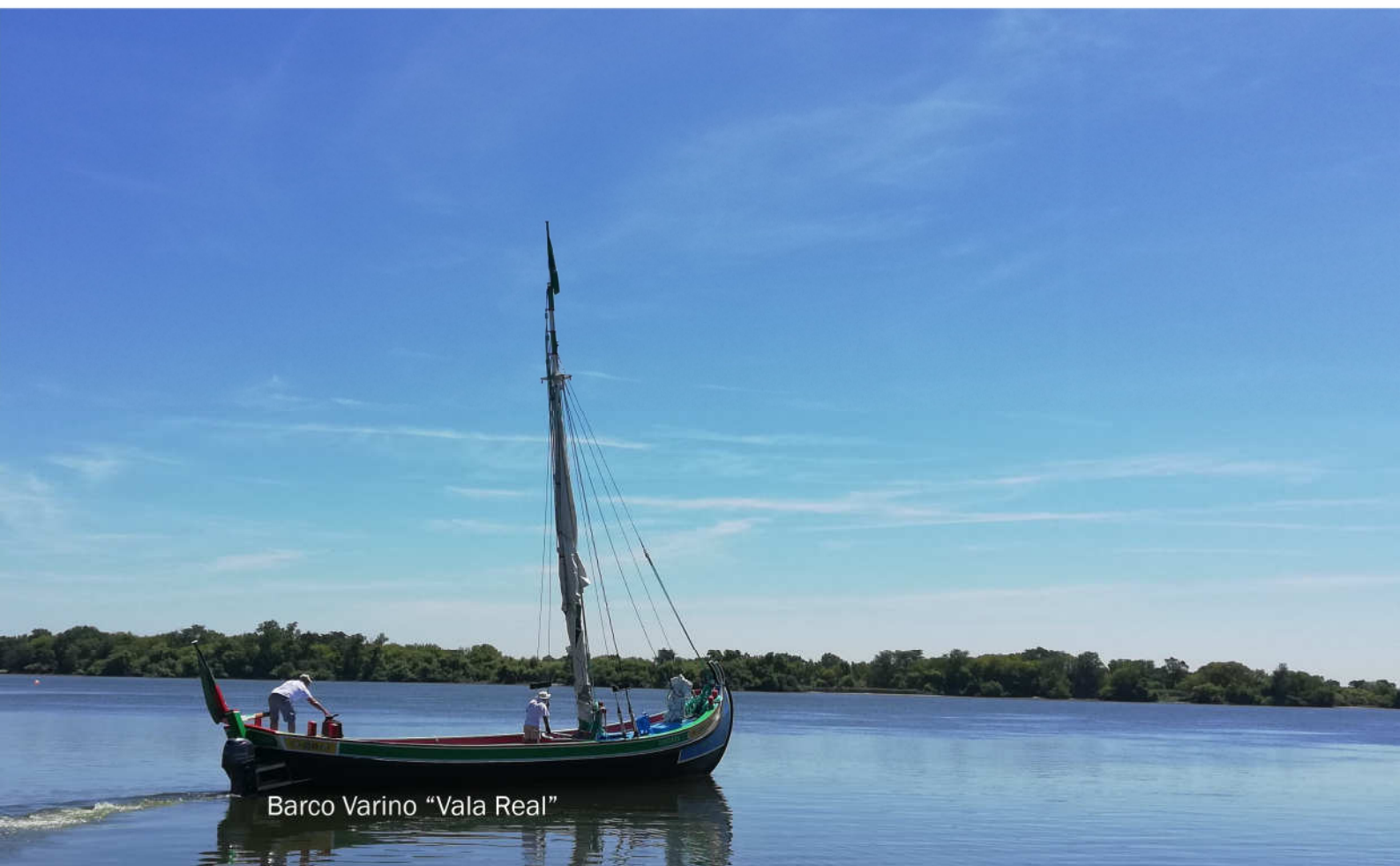
Barco Varino "Vala Real"