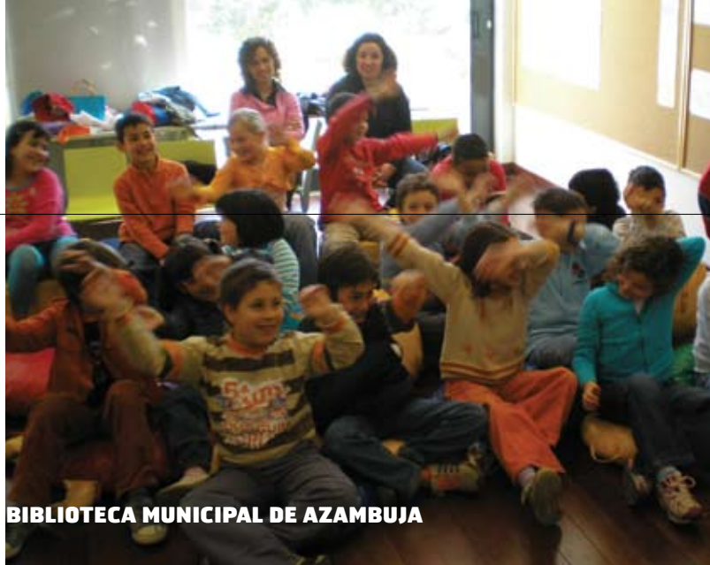
BIBLIOTECA MUNICIPAL DE AZAMBUJA

Espaço Multimédia: Utilização de Computadores; Acesso à Internet; Visualização de Vídeos e DVD's