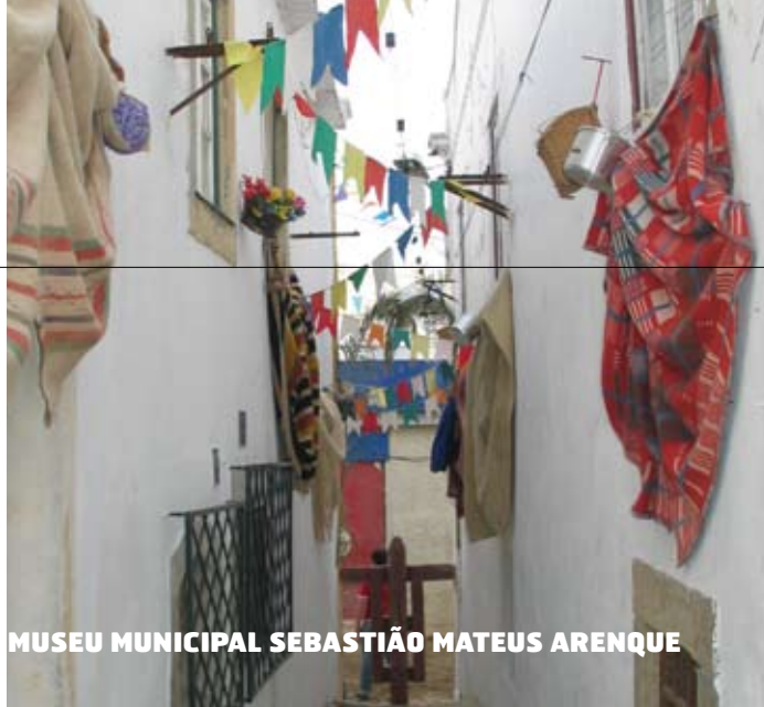
MUSEU MUNICIPAL SEBASTIÃO MATEUS ARENQUE