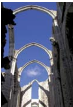
Ruínas do Convento do Carmo - Lisboa

de D. Fernando e de D. João I que D. Nuno Álvares Pereira serviu? O ano de 1376 é marcante.