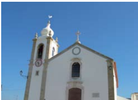
Igreja de Vila Nova da Rainha