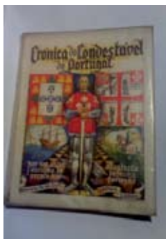
Frontespício da «Crónica do Condestável de Portugal»