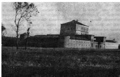
Quartel de Alcoentre (Paço dos condes de Vimieiro), edificado por Martim Afonso de Sousa no séc. XVI.

Era grande o descontentamento vivido no Portugal nas duas primeiras décadas do séc. XIX, numa altura em que a Corte de D. João VI estava no Brasil e não tinha intenção de regressar, o domínio inglês era preponderante em todos os domínios e uma Junta Governativa subserviente a esses interesses. A situação agravou-se quando Beresford tenta impor a obediência das chefias