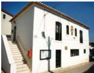
Casa da Câmara de Alcoentre (séc. xviii).

Vão decorrer três conturbados anos em que o País muda radicalmente, agora regido política e juridicamente sob a bandeira da Constituição de 1822, mas constantemente sobressaltado com várias tentativas contra-revolucionárias de estabelecer a antiga ordem e a principal e que nos leva de novo a Alcoentre, aconteceu a 23 de Fevereiro de 1823.