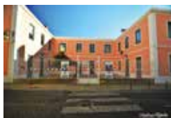
BIBLIOTECA MUNICIPAL DE AZAMBUJA