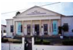
BIBLIOTECA MUNICIPAL DE AVEIRAS DE CIMA