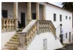
BIBLIOTECA MUNICIPAL DE ALCOENTRE

MASCARA-TE E CONTRIBUI PARA A CEIA PARTILHADA LOCAL: POISADA DO CAMPINO ORGANIZADO PELA RBMA