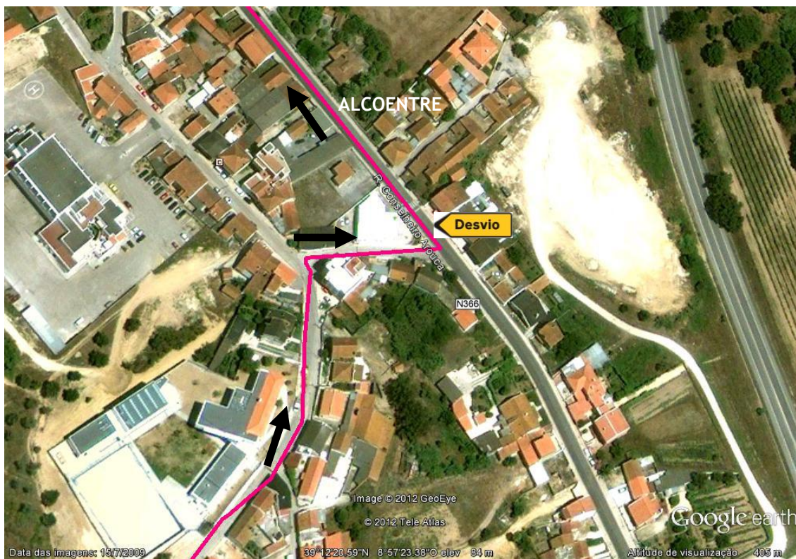
Chegada á N366, no centro de Alcoentre.