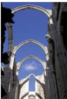
Ruínas do Convento do Carmo - Lisboa

de D. Fernando e de D. João I que D. Nuno Álvares Pereira serviu? O ano de 1376 é marcante.