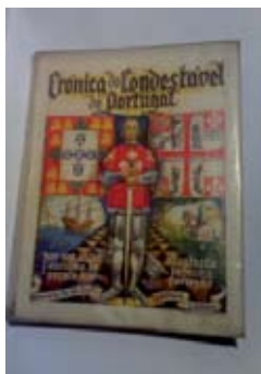
Frontespício da «Crónica do Condestável de Portugal»